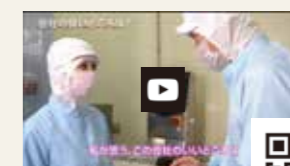
● ライクスタカギ様