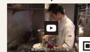
● イタリアンレストラン プレジデンテ様