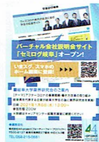
◀岐阜大学広報誌「岐大のいぶき」に広告掲載

通常通りの説明会を録音し、弊社で記事化を行います。貴社に特別な労力は、かかりません